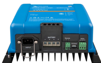
Phoenix Smart 12/50 (3)